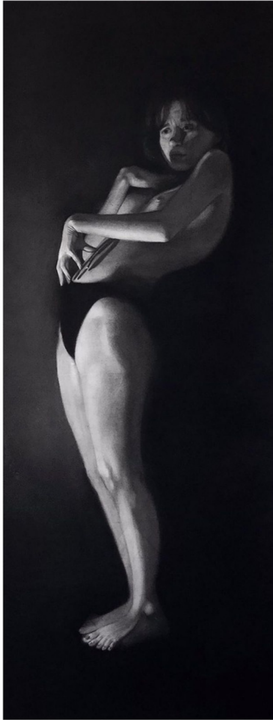
" 1 D" Carboncillo sobre papel 200*80cm 2022