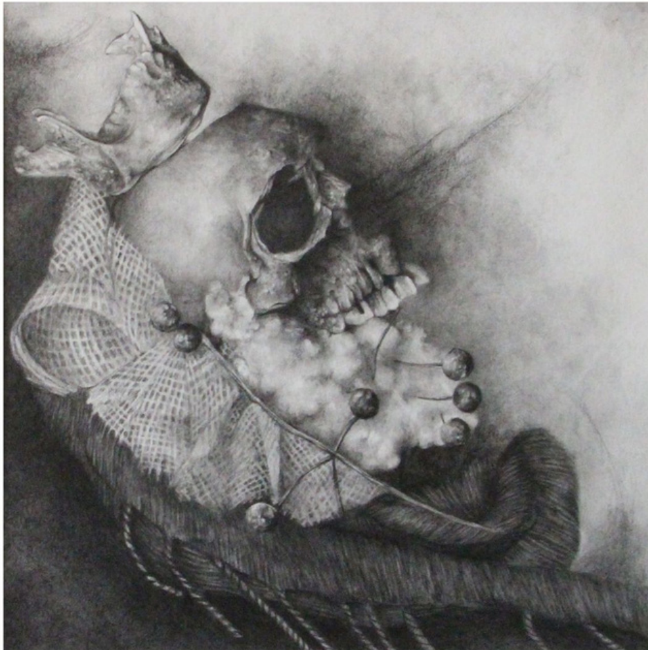
"Lupe" Grafito sobre papel 30*30cm 2016