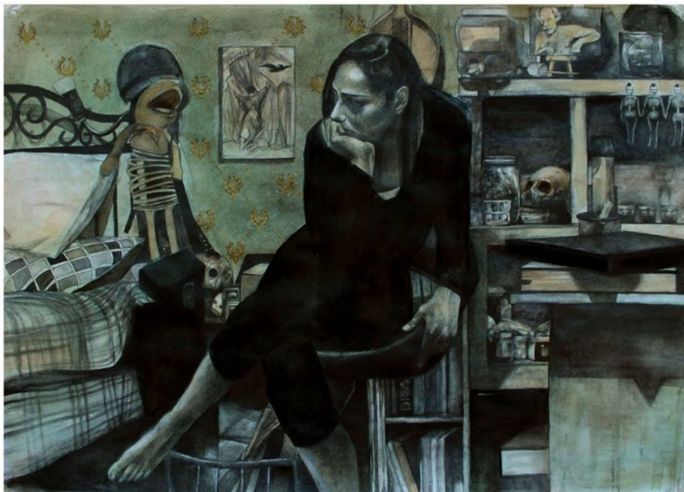
"La habitación" Grafito y acuarela sobre papel 80*100cm 2017